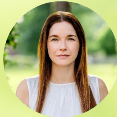
Liane Maxion Naturata AG