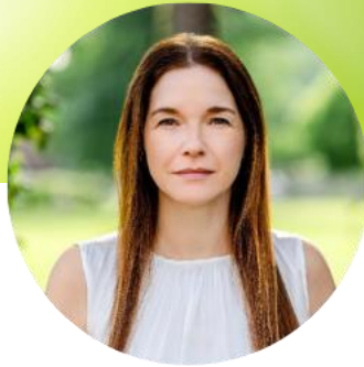
Liane Maxion Naturata AG