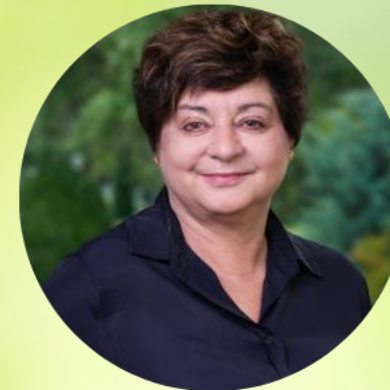
Anne Mutter Holle baby food AG