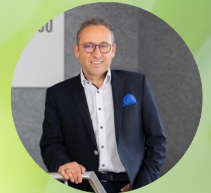
Andreas Swoboda Bio Breadness GmbH