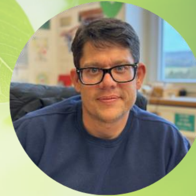
Alexander Bauer Purvegan GmbH