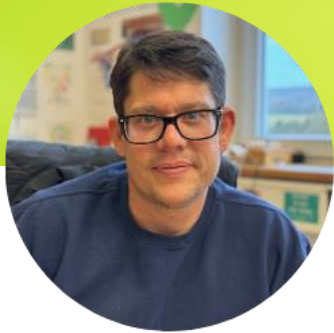
Alexander Bauer Purvegan GmbH