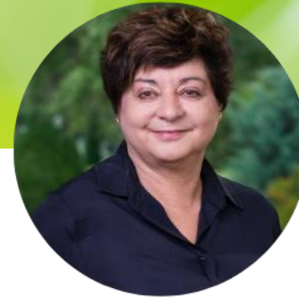
Anne Mutter Holle baby food AG