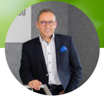
Andreas Swoboda Bio Breadness GmbH