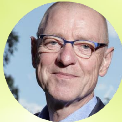
Jürgen Hansen JH Vermarktung GmbH