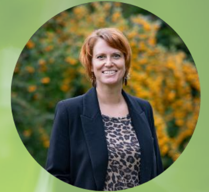
Anne Baumann AöL e.V.