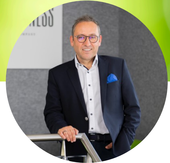
Andreas Swoboda Bio Breadness GmbH