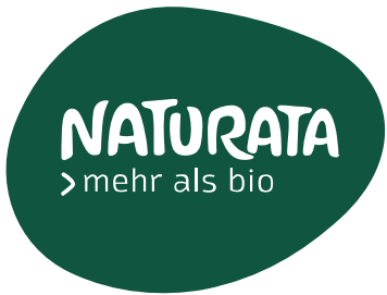
Liane Maxion Naturata AG